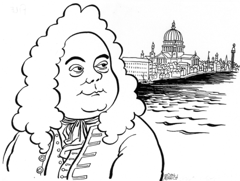
Händel in Londen

In de tijd van Händel en Bach worden orkestsuites gecomponeerd voor feestelijke en officiële gelegenheden en soms als muziek bij toneelstukken. Deze suites beginnen altijd met een statige ouverture, waarna een reeks gestileerde dansen volgt, zoals rondeau, sarabande, bourree, polonaise, gavotte, menuet en gigue. In de barok bestaat het orkest uit een strijkersgroep en basso continuo, een groepje binnen het orkest (meestal klavecimbel en cello) dat de begeleiding verzorgt. Om het extra feestelijk (en luidruchtig) te maken, worden bij suites vaak hoorns, hobo's, fluiten, trompetten en pauken aan het barokorkest toegevoegd. Soms worden orkestsuites samengesteld uit reeds bestaande composities. De 18e-eeuwse Parijse 'opera-balletten' (opera's met veel ballet – het woord zegt het al) zitten vol orkestrale