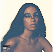
POP SOLANGE WHEN I GET HOME (Columbia)

H ouston, de vierde stad van de Verenigde Staten, is niet alleen groot en druk maar ook vervuild en misdadig. Je hoort het niet af aan When I Get Home , het vierde album van Solange. Op de plaat keert ze terug naar Houston, Texas, de stad waar ze werd geboren en opgroeide in het zwarte stadsdeel Third Ward. Het levert alle behalve hectische muziek op. When I Get Home klinkt dromerig, relaxed en vreedzaam.